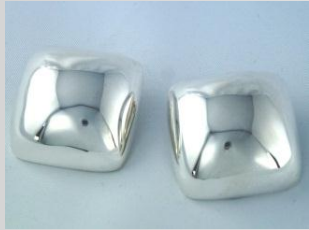
„Dicke Kissen“ C 6001-699 25g 2,6 x 2,6 cm