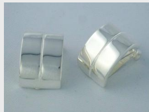
„Track“ C 6001-774 12g 2,0 x 1,4 cm