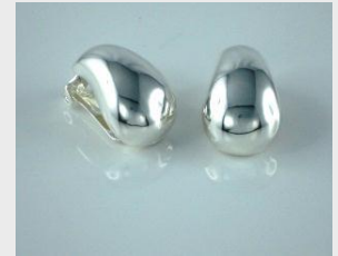
„Schnuller“ C 6001-760 13g 2,0 x 1,5 cm