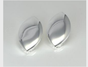
„Segel“ C 6001-630 17g 3,8 x 2,0 cm