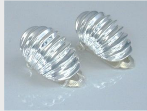
„Raupe“ C 6001-821 12g 1,8 x 1,6 cm