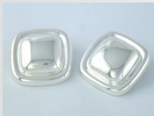
„Quadrat mit Rändchen“ C 6001-397 19g 2,6 x 2,6 cm