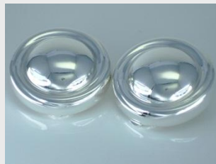
„Rad mit Rändchen“ C 6001-398 20g 3 cm rundum