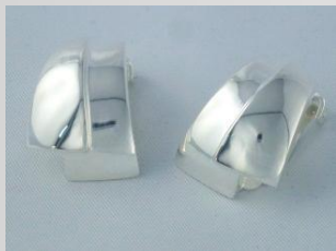
„Kleiner Doppelbogen“ C 6001-761 11g 2,0 x 1,5 cm