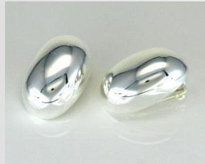
„Große Ovale“ C 6001-756 14g 2,5 x 1,7 cm