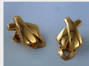
„Kleine Schleife“ C 6001-631 10g (Beispielhaft in vergoldet) 2,0 x 1,5 cm