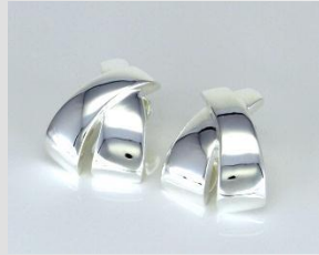
„Große Schleife“ C 6001-609 17g 2,7 x 2,0 cm