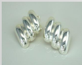
„Fusilli“ C 6001-582 14g 3,0 x 2,0 cm