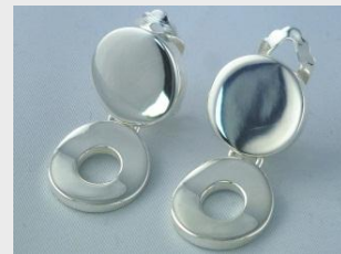
„Zirkus“ C 6001-792 16g 1,6 cm je Kreis