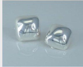
„Kleine Kissen“ C 6001-754 12g 1,8 x 1,8 cm