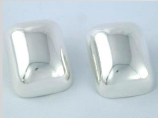
„Großes Rechteck“ C 6001-755 16g 2,5 x 2,0 cm