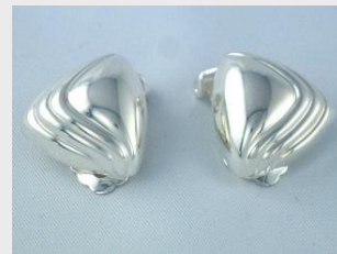
„Kleine Dreiecke“ C 6001-517 15g 1,8 x 1,8 x 1,8 cm