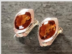
„Capri“ C 6001-779 18g mit Madeira Citrin 1,7 x 1,4 cm