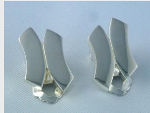
„Konvex“ C 6001-757 9g 2,0 x 1,5 cm