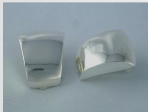
„Trapez“ C 6001-762 18g 2,6 x 2,0 cm