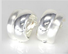
„Bögelchen“ C 6001-636 14g 2,0 x 1,3 cm; 1,7cm hoch