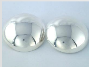
„Große Kreise“ C 6001-424 23g 3 cm rundum