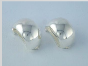
„Kleiner Rennwagen“ C 6001-029 11g 2,2 x 1,2 cm