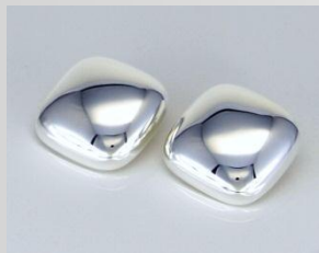
„Flache Quadrate“ C 6001-414 19g 2,6 x 2,6 cm