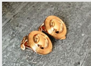
„Sonnenrad“ C 6001-617 9g (Beispielhaft in vergoldet) 1,8 cm rundum