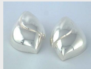
„Tulpenblüte“ C 6001-400 19g 3,6 x 2,5 cm