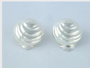
„Muschel“ C 6001-494 8g 1,8 cm rundum