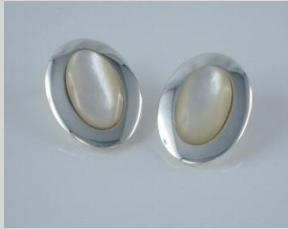
„Perlmutter“ C 6001-591 14g 1,9 x 1,2 cm